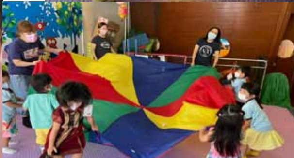
PUGGLES 小寶營 (2-4 歲 N1-K1)