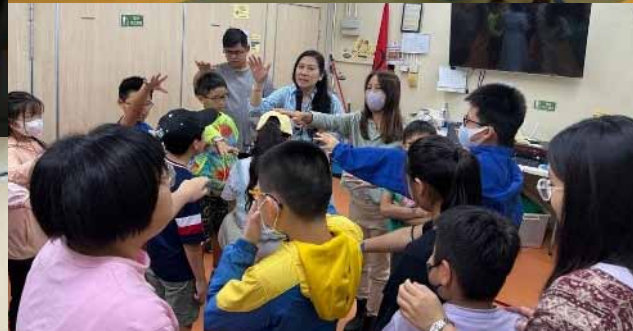
FAITHFUL TEENS 信心營 (P.4-P.6)