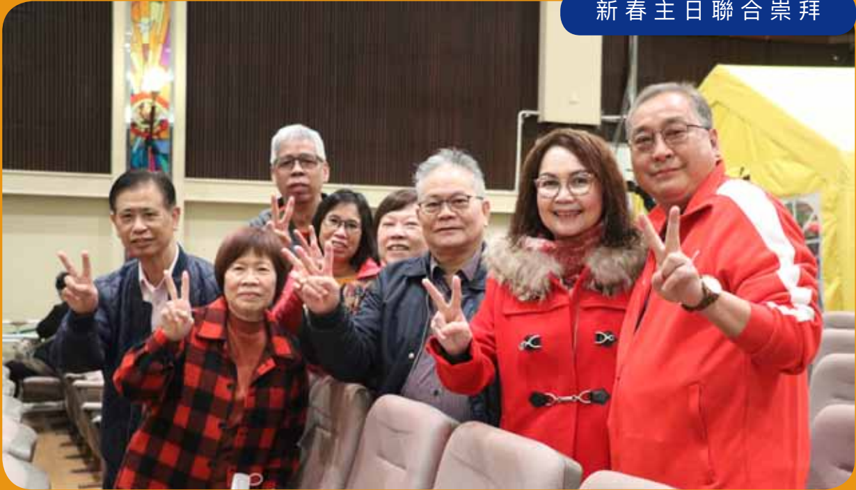
新春主日聯合崇拜