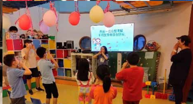
JOYFUL KIDS 童樂營 (P.1-P.3)