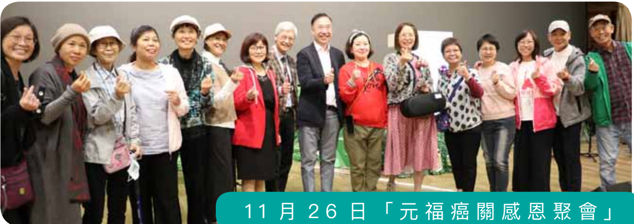
11月26日「元福癌關感恩聚會」