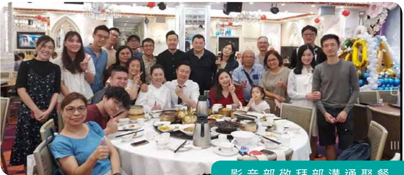
影音部敬拜部溝通聚餐