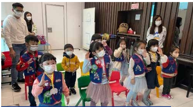
CUBBIES 小熊營 (K2-K3)